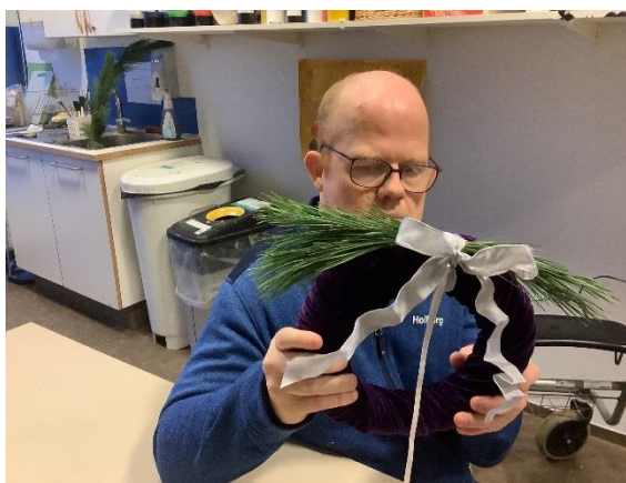
Myndir frá jólanámskeiðum í desember 2021.

menntun – valdefling – samstarf – sveigjanleiki