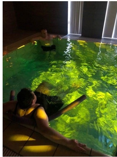
Myndir af námskeiðum í H.A.F. jóga

menntun – valdefling – samstarf – sveigjanleiki