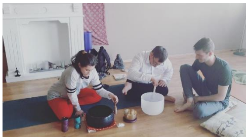
Mynd úr jógatíma í Yogasmiðjunni.

Samstarf var við málaskólann Múltíkúltí. Þar voru haldin bæði ensku- og spænskunámskeið.