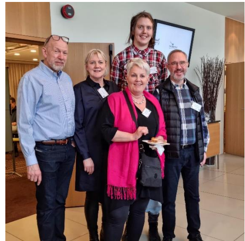
Stjórn Fjölmenntar 2019-2022 ásamt forstöðumanni.